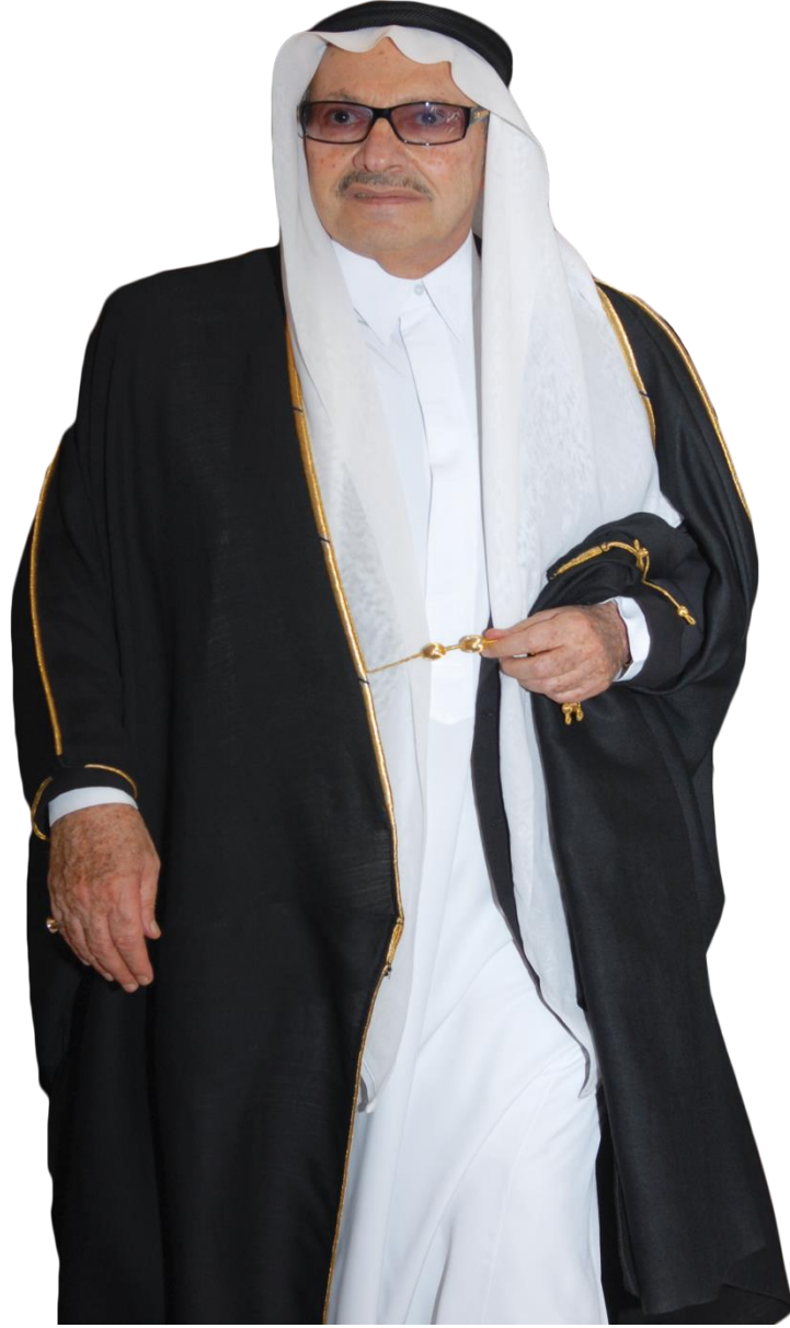
"مستقبل الجامعة واعد وذاخر" مؤسس الجامعة العربية المفتوحة والملمهم الأول صاحب السمو الملكي الأمير طلال بن عبدالعزيز (رحمه الله) (١٩٣١-٢٠١٨)

"قناعتنا راسخة بأن المستقبل سيكون أفضل بإذن الله، ولكن هناك فرق كبير بين أن نأمل.. وأن نعمل.. فالأمل هو المحرك والمحفز لجميع الطاقات، أما العمل فهو المحقق لكل ما نتمناه، فليؤد كل منا واجبه.. ولنبدل جميعاً جهودنا، فشعوبنا تستحق حياة أفضل، وتنتظر منا الكثير."